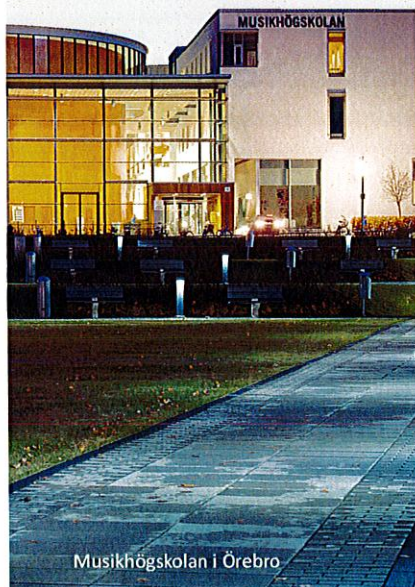
Musikhögskolan i Örebro

www.regionorebrolan.se/kulturting www.facebook.com/kulturting